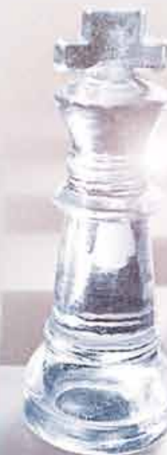
Werner Faymann Bundeskanzler

Die win 2 Zukunftskonferenz leistet einen wertvollen Beitrag zur Förderung eines gelebten Miteinanders. Der regelmäßige Austausch von Meinungen und Erfahrungen, die Vernetzung der Führungskräfte von heute mit den Entscheidungstragenden von morgen, schaffen Grundlagen für eine aktive Zukunftsgestaltung. Ich wünsche den TeilnehmerInnen der win 2 Konferenz viel Erfolg und spannende Diskussionen.